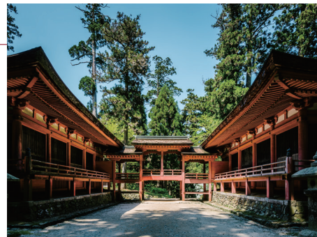
히에이잔 엔랴쿠지 절 (니나이도오)