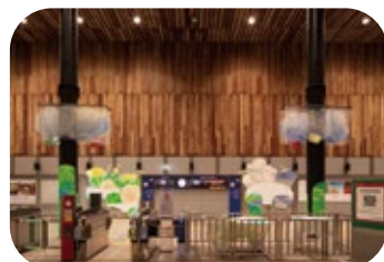
【なにわ橋駅 2023年展示風景】ヨシムラリエ