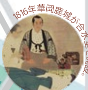
1816年華岡鹿城が合水堂を開設