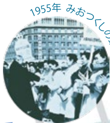
1955年 みおつしの鐘運動

アートで国際交流 「日中(大阪・上海)こども美術展」 大阪市と上海市が友好都市提携をして今年で50周年になります。