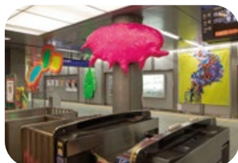
【渡辺橋駅 2023年展示風景】園川絢也