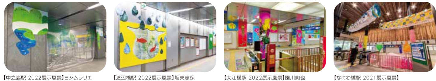
【中之島駅 2022展示風景】ヨシムラリエ 【渡辺橋駅 2022展示風景】坂東志保 【大江橋駅 2022展示風景】園川絢也 【なにわ橋駅 2021展示風景】こども元気こいのぼり×園川絢也

中之島をひもとくこころのストーリー 中之島エリアの歴史を紐解きイメージしたアート作品とワークショップをご体感ください。