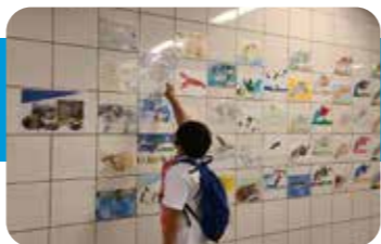
大江橋駅に展示します。

みんなが幸せな未来にそうぞうをふくらませよう!いきものには、みんな命がある。たくさんのいきものが色々な場所で互いにつながり合って生きている。細胞、植物、どうぶつ、人間、地球、宇宙…。すべての命のものがたり。