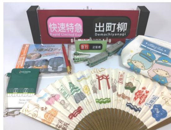
京阪ブースで発売する商品（一例）