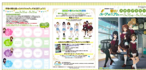
「京阪電車×宇治市 響け!ユーフォニアム スタンプラリー」 ラリー用紙