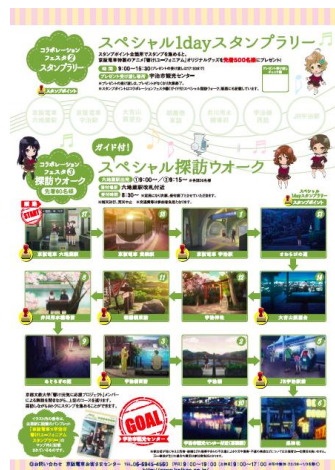
ラリー用紙(チラシ裏面)