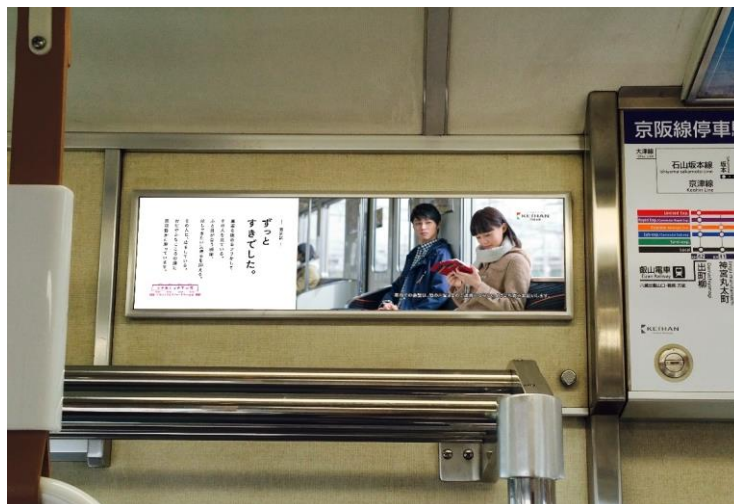
車内掲出イメージ

2. 掲出場所 車内ドア上横 (サイズ: 縦150mm×横530mm) ※該当枠のない車両は対象外