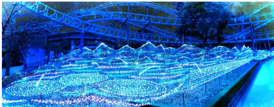
▲「光の遊園地」イメージ ( 左：森の小径 ・ 右：星夜の海 )