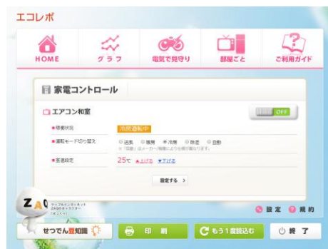
▲家電コントロール画面 (サンプル)