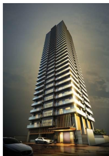
ファインシティ札幌ザ・タワー大通公園 完成予想パース