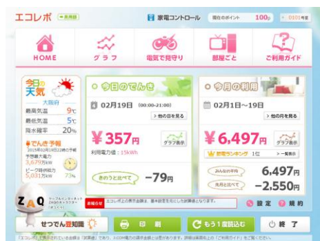
▲エコレポ TOP 画面 (サンプル)