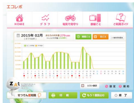
▲電力使用量画面 (サンプル)