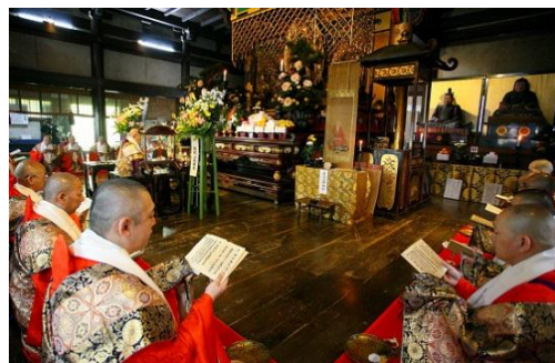
慈覚大師御影供における声明の様子