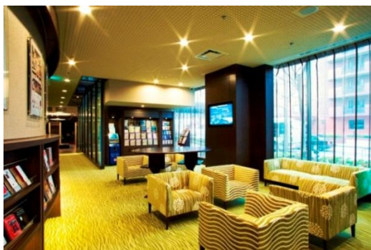
1階 京都観光情報ライブラリー