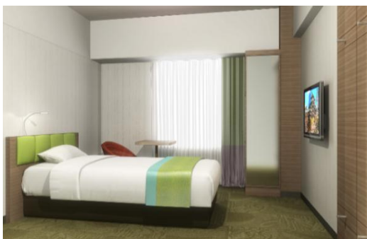
シングルルーム（イメージ）