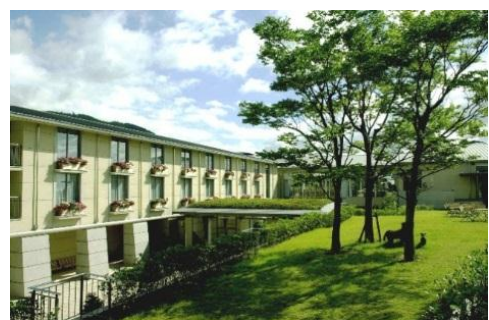
ロテル・ド・比叡