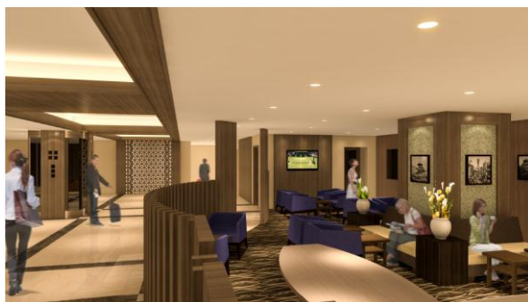
1階 ロビースペース（イメージ）