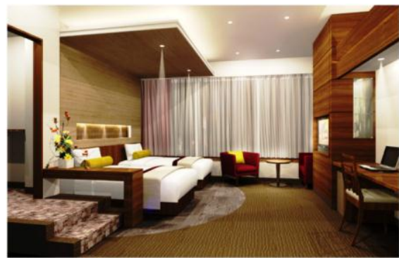
13階スーペリアフロア ツインルーム（イメージ）