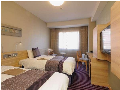
スタンダードフロア ツインルーム