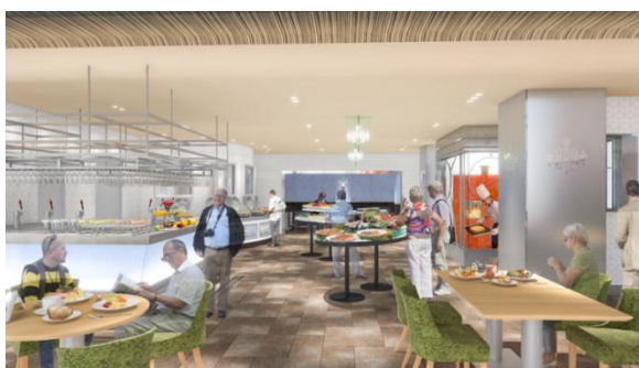
レストラン (イメージ)