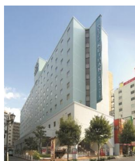
ホテル京阪天満橋