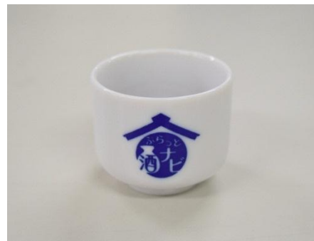
オリジナルおちょこ