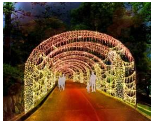
▲新園長・超ひらパー兄さん改革 第4弾「光の遊園地」イメージ （左：「妖精の楽園」エリア、右：「炎の洞窟」エリア）