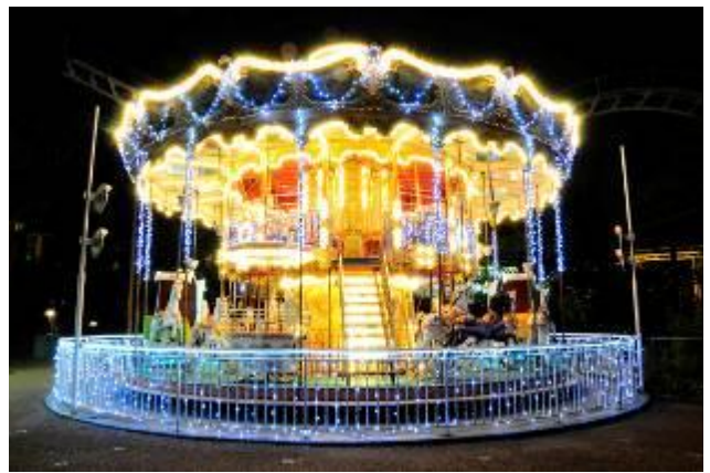
▲メリーゴーラウンド