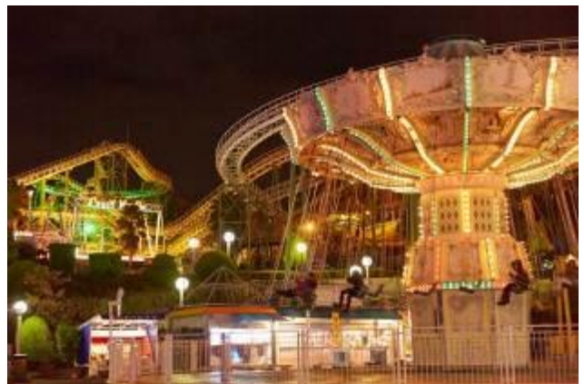
▲ウェーブスインガー