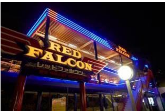
▲レッドファルコン