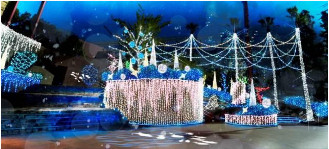
▲宝石の海（ハブプラザ）