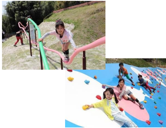
▲あたま系アスレチック ヤッテミ〜ナ」イメージ