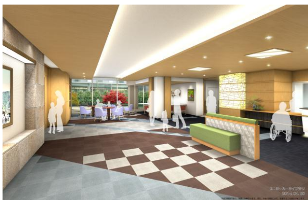
「ローズライフ京都」ラウンジ（イメージ図）

計画地は、京都市高度医療・保健衛生福祉地区計画の都市計画区域に位置しており、地域災害医療センターの役割を担う「京都市立病院」に隣接するとともに、西隣に京都地域医療学際研究所附属病院「がくさい病院」が開設されます。また、地域の医療機関との連携により、医療受診、介護予防、リハビリ、健康維持増進などの医療サポートが受けられる安心の環境となっています。