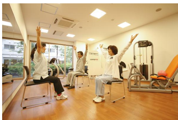
心身の健康づくり（イメージ写真）