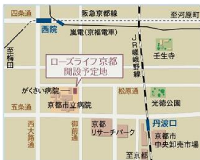
「ローズライフ京都」周辺案内図