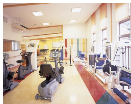
堂山公園デイサービスセンター