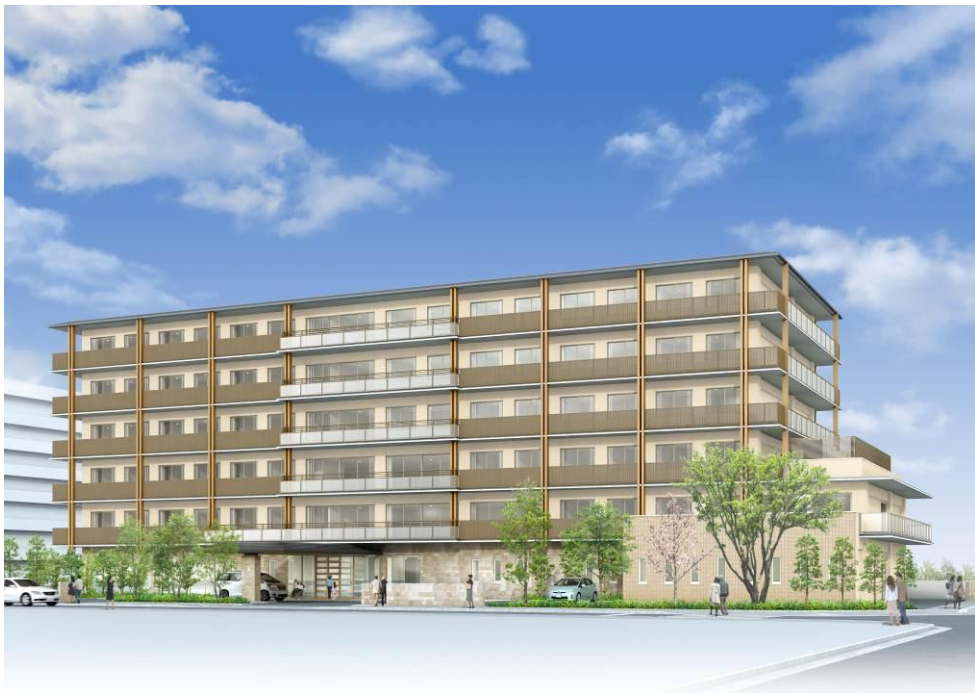
「ローズライフ京都」完成イメージ