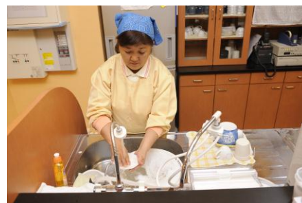
訪問介護サービス