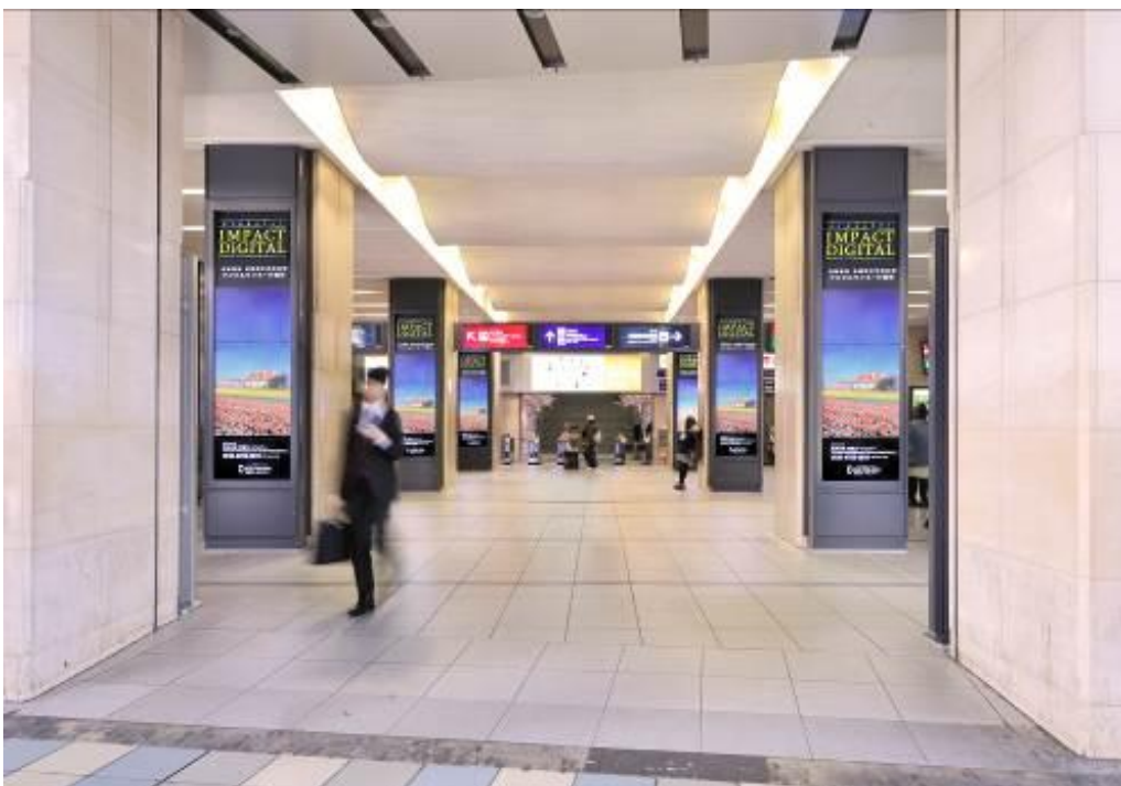
「京橋インパクトデジタル」イメージ（JR側から京阪京橋駅改札を望む）