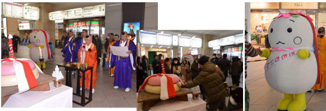
▲昨年の様子（左：入魂式、右：展示餅体験企画）

「五大力尊仁王会」は「五大力さん」の名で親しまれ、不動明王など五大明王（ごだいみょうおう）の力を授かり、国の平和、国民の幸福などを願う行事で、1100年以上の歴史を持っています。「餅上げ力奉納」では、女性用・約90kg、男性用・約150kgの巨大な鏡餅をどれだけ長く持っていられるかを競うとともに、その力を五大明王に奉納し、無病息災や身体堅固を祈ります。