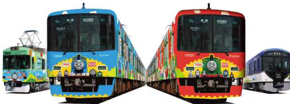
▲左から「700形きかんしゃトーマス号2013」、「10000系きかんしゃトーマス号2013」、 新登場の「10000系きかんしゃパーシー号2013」、「3000系きかんしゃトーマス号2013」