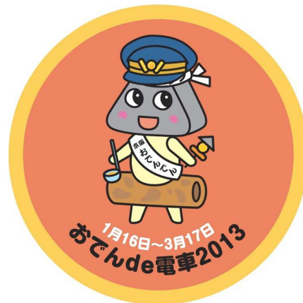
▲掲出ヘッドマークイメージ