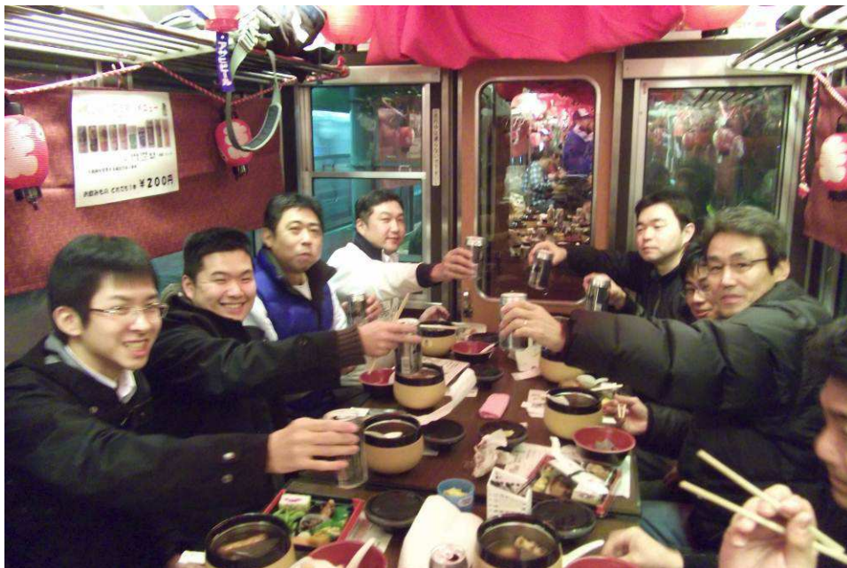
「おでんd e 電車」車内のようす（昨年）