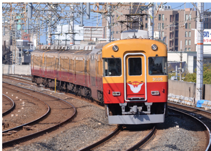
旧3000系特急車（テレビカー）