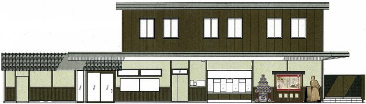
リニューアル後の中書島駅イメージ