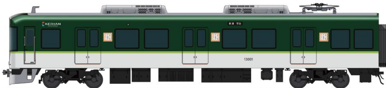
「ギャラリートレイン」外観イメージ