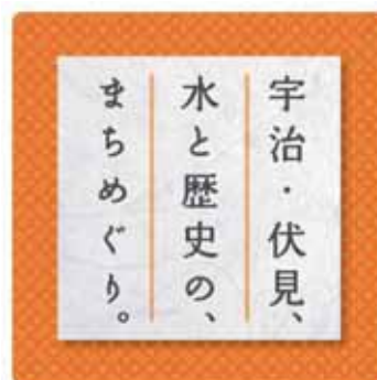
ヘッドマークおよびステッカーデザイン