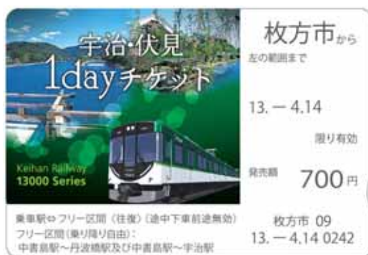
限定デザインカード（10,000枚限定）