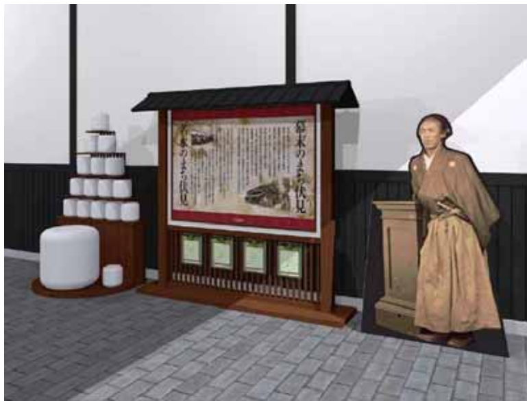
坂本龍馬と酒樽モニュメントイメージ