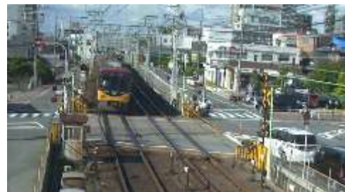
踏切監視カメラが撮影した画像

踏切の状況確認や記録を目的とした監視カメラを設置しています。2021年度末時点で京阪線の全踏切道に設置が完了しています。