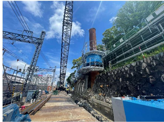
終点方取付部付近における斜面切取工事

2022年度より鉄道工事に着手しており、現在は、起終点部および香里園駅部において仮線・仮駅工事を施工しています。