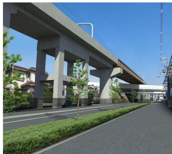
完成後 ※画像は現段階でのイメージです。