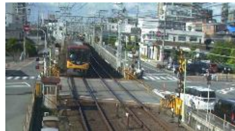
踏切監視カメラが撮影した画像

踏切の状況確認や記録を目的とした監視カメラを設置しています。2021年度末時点で京阪線の全踏切道に設置が完了しています。