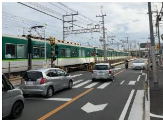
現況 （光善寺駅～枚方公園駅間）

この事業は、香里園駅・光善寺駅・枚方公園駅の3駅を含む京阪本線約5.5kmを高架化するもので、21カ所の踏切が除去されることで、交通渋滞の緩和や運転保安度の向上につながります。