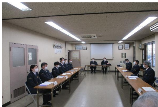
巡視時の意見交換