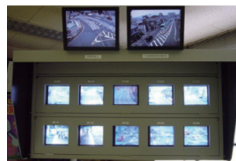
併用軌道監視装置

京津線の「浜大津駅～上栄町駅間615m」および石山坂本線の「浜大津駅～三井寺駅間380m」の区間は併用軌道(道路上に敷設された軌道)のため、日々変化する道路状況を速やかに把握し、より安定的な列車運行ダイヤが確保できるよう、24時間体制で監視業務を行っています。