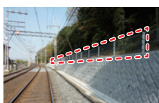
橋本駅～八幡市駅間 土砂崩壊検知線

豪雨などの際、線路内に流入してきた土砂により検知線が切断された場合、接近する列車に対し、緊急停止信号を発信する装置を2箇所(枚方公園駅～枚方市駅間および橋本駅～八幡市駅間)に設置しています。