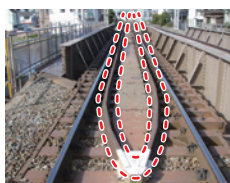
橋上ガードレール

橋梁上やその付近で列車が脱線した場合、列車を橋梁下に転落させないための設備です。