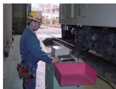
輪重測定装置による管理

車両の脱線に対する安全性を向上させる目的で、京阪線(寝屋川)と大津線(錦織)の車庫にそれぞれ輪重測定装置を設置しており、左右の車輪にかかる重量のバランス(静止輪重差)を厳密に管理しています。