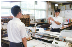
出勤点呼時アドバイス

また、運転指令者は、列車無線を使って天候などそのときの状況にあったアドバイスも行っています。