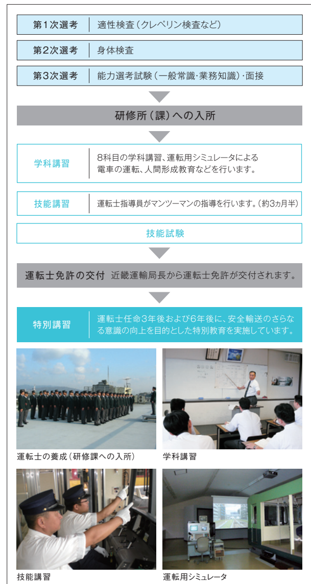
運転士の養成(研修課への入所)