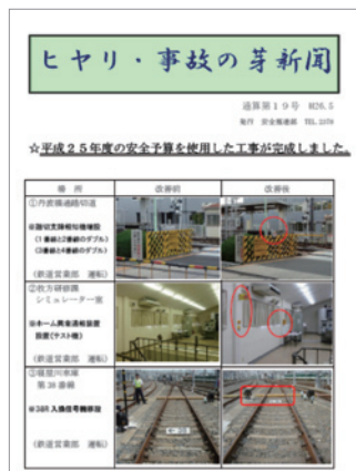
ヒヤリ・事故の芽新聞

各職場から集約され、報告された情報は「ヒヤリ・事故の芽新聞」に掲載されることで潜在する危険についての情報を共有します。また、「ヒヤリ・事故の芽会議」の審議を経て、優先度の高いものについては設備の改善を実施し、事故の芽の早期除去に努めています。