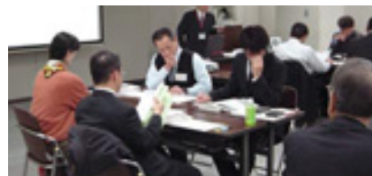
▲環境法規制セミナー

実施項目の一例として環境法規制に関する知識の習得や京阪EMSの概要・当社の環境に関する取り組み内容などを訓練しています。