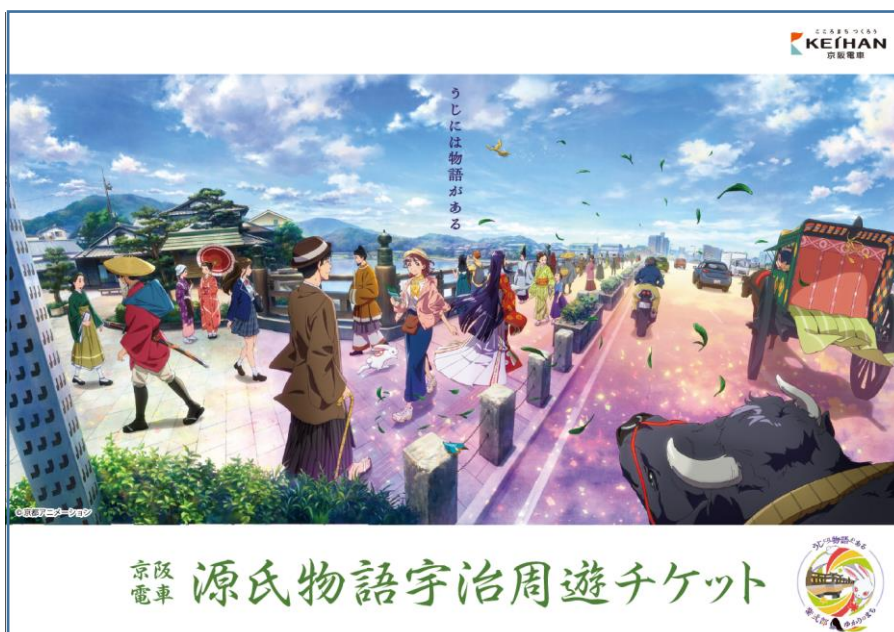
源氏物語宇治周遊チケット台紙