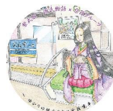
ヘッドマークデザイン