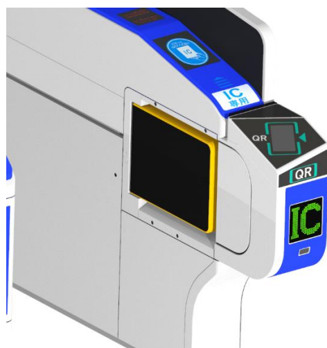
QR コード乗車券、IC カード対応改札機 (イメージ)