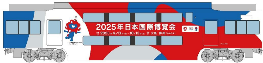
中間車(ダブルデッカー、4両目)