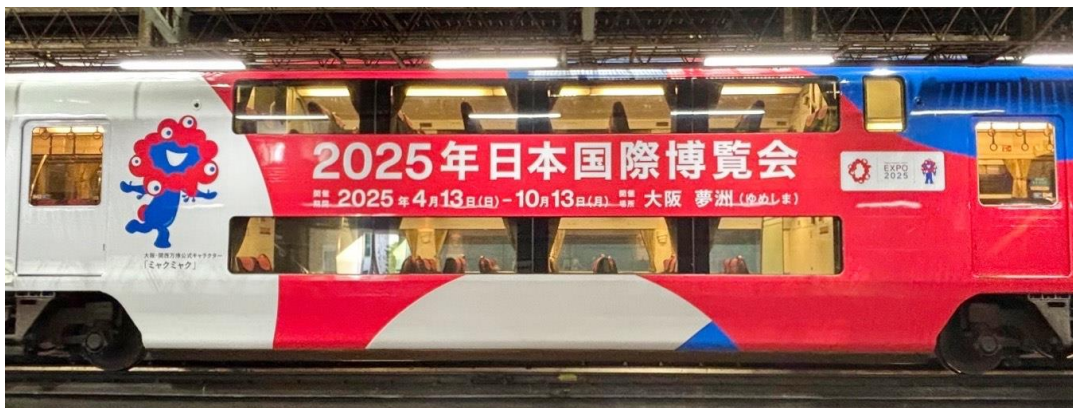
万博ラッピングトレイン(8000系・ダブルデッカー車)