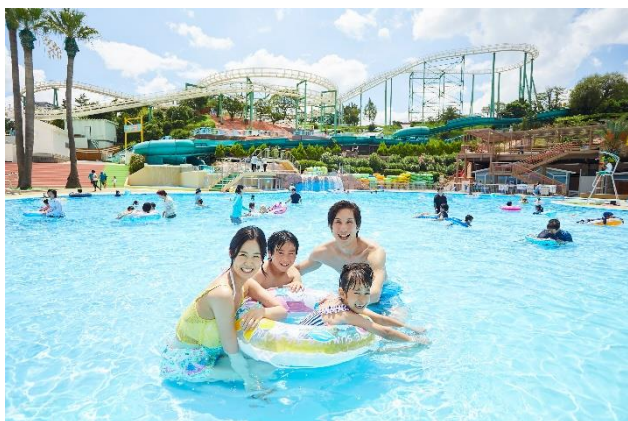
▲奥に行くほど深くなる「なぎさプール」

昨年から導入した「有料レストスペース」は、並ばずに休憩スペースが確保できるとあって、大変好評をいただきました。ご要望にお応えし、今年は席数を増やし、さらに新シートも登場します。楽しく、快適にお過ごしいただける「ザ・ブーン」にぜひお越しください。