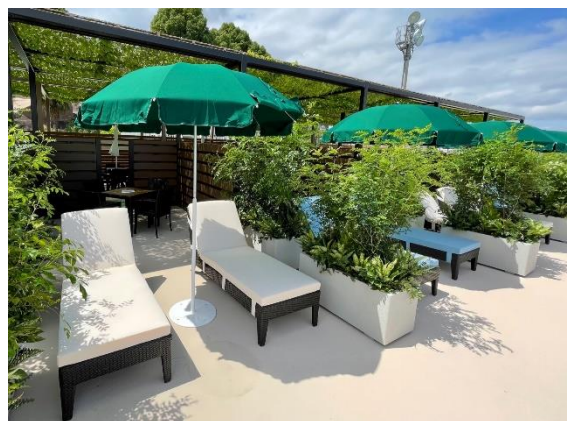
▲有料レストスペース「プレミアムスイートテラス」