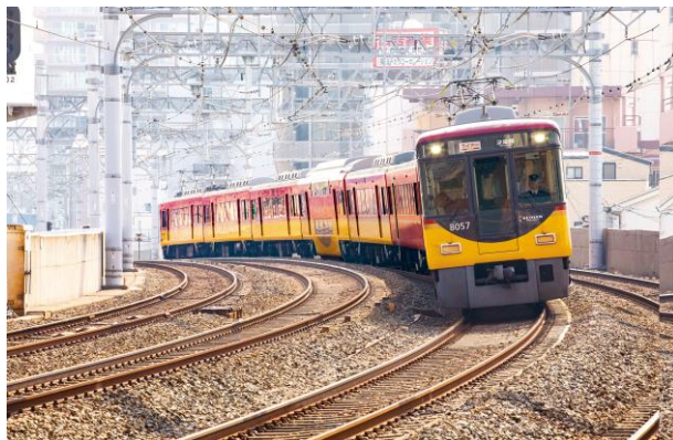
8000系「ライナー」 (6号車が「プレミアムカー」)