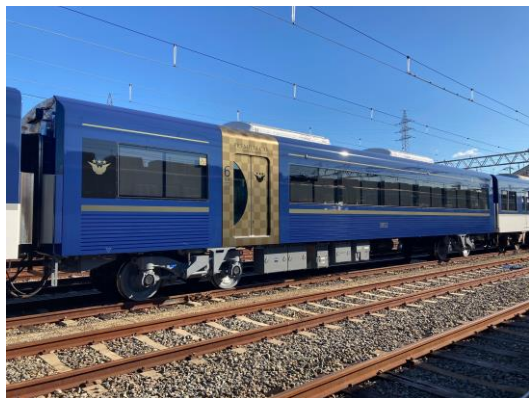
3000系「プレミアムカー」

ぜひ、この機会に新ポイントサービスでお得になったプレミアムカークラブをご利用ください。詳細は別紙の通りです。