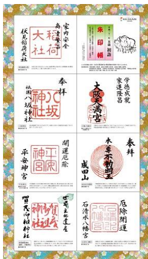
初詣朱印帳(京阪線版)