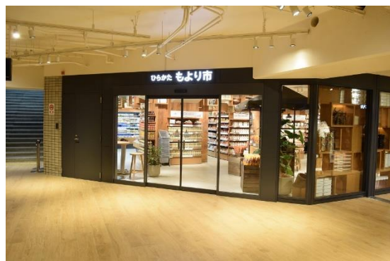
商業ゾーン「ひらかた もより市」

駅構内では、ミニスーパーマーケットやコンビニエンスストアなどを集積した駅ナカ商業「ひらかた もより市」をオープン。コンパクトで機能的な食の専門店が誕生しました。