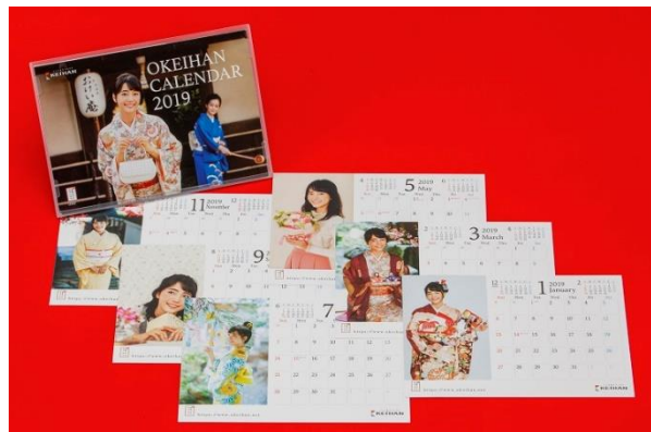
2019 おけいはん卓上カレンダー