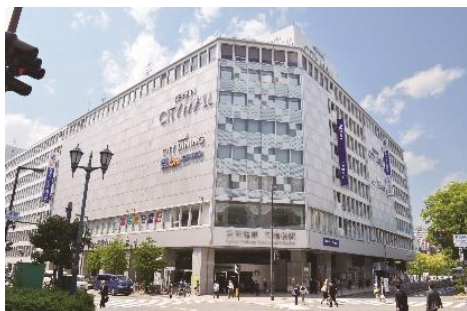
京阪シティモール