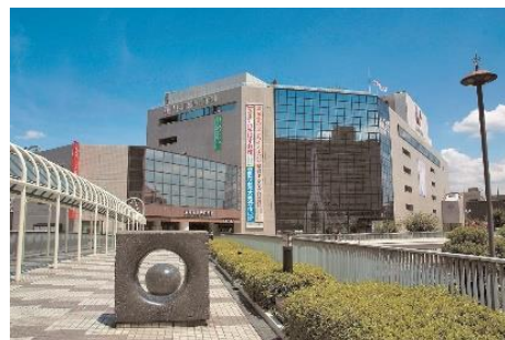
京阪百貨店 守口店