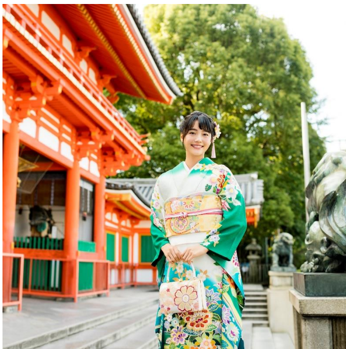
京阪沿線 お正月 PR メインビジュアル「おけいはんの初詣」編