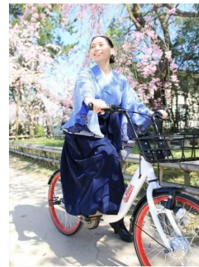
【シェアサイクル利用イメージ】