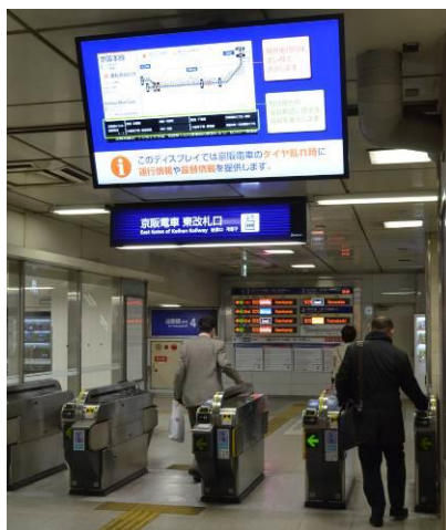
旅客案内ディスプレイ（天満橋駅）

これにより、輸送障害発生場所や列車の遅延・運休、振替輸送などの情報の視覚的かつ速やかなご提供が可能となります。なお、平常時は沿線観光案内やマナー啓発など多様な用途に活用し、より一層の案内サービスの充実を図っていきます。