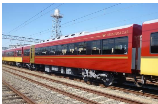
「プレミアムカー」外観

今年8月20日（日）の座席指定の特急車両「プレミアムカー」導入に向けて、車両リニューアルや発券カウンター設置などの整備を進めています。