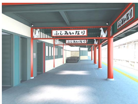
伏見稲荷駅ホームイメージ（リニューアル後）