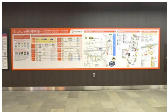
観光総合案内板（祇園四条駅）

観光総合案内板は、これまでに主要駅7駅で設置しており、今年度は淀屋橋駅や清水五条駅など6駅への設置を計画しています。