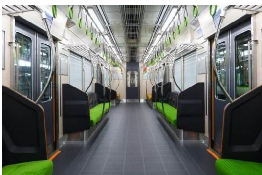
リニューアル後の6000系車両

導入から30年以上が経過した6000系車両について、平成25年度よりリニューアルを進めています。車いすスペースや液晶型車内案内表示器などバリアフリー化への対応のほか、内装材の取り替えや座席の更新など車内の刷新を進めています。