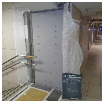
耐震補強工事（イメージ）