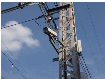
踏切監視用カメラ