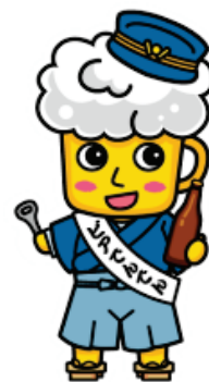
▲オリジナルキャラクター 「ピアでんでん」