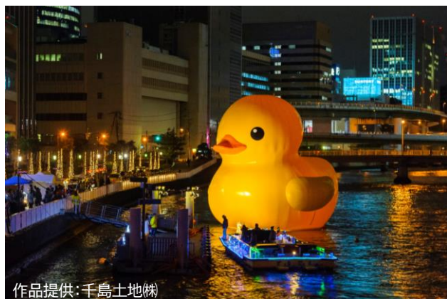
作品提供: 千島土地㈱