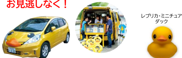
レプリカ・ミニチュア ダック