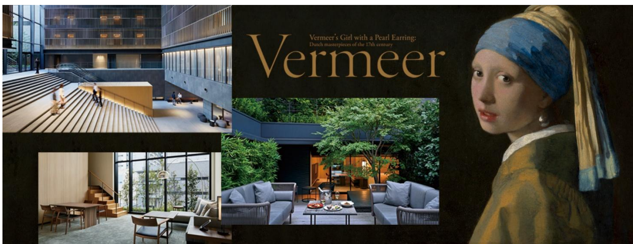
(左上) ザ・サウザンド京都 大階段 (左下) ザ・サウザンド京都 ザ・サウザンド・スイート (中央) ザ・サウザンド京都 ガーデン・スイート (右) ヨハネス・フェルメール 《真珠の耳飾りの少女》1665年頃 マウリツハイス美術館