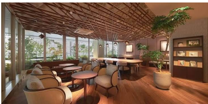
3階ラウンジにガイドブックをご用意