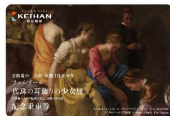
記念乗車券付（画像はイメージ・1室1セット）