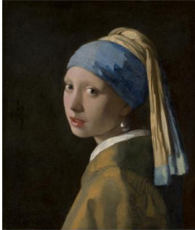
ヨハネス・フェルメール《真珠の耳飾りの少女》1665年頃 マウリッツハイス美術館