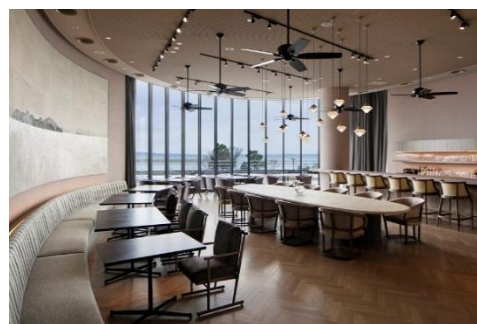
「クラブラウンジ」店内