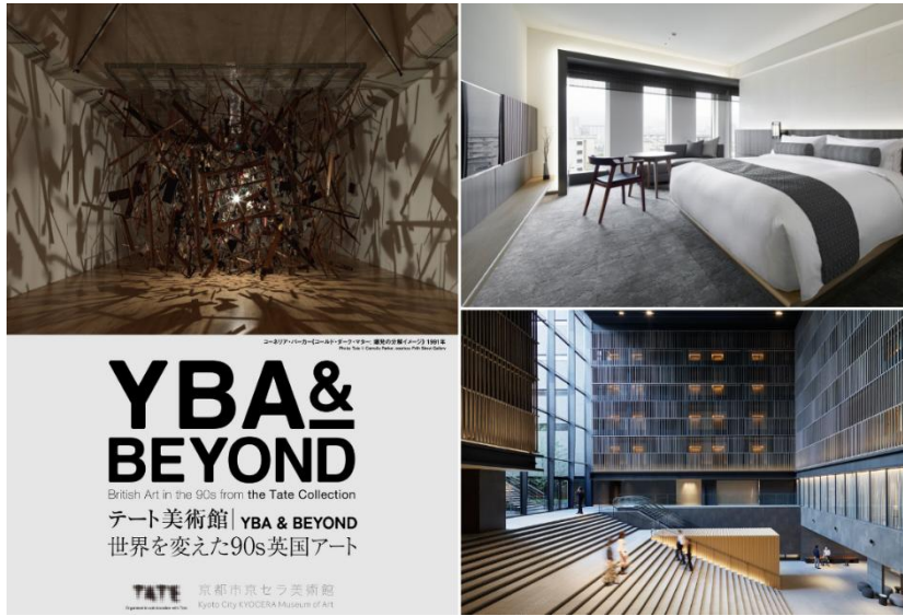
(左) メインビジュアル (右上) ザ・サウザンド京都 スーペリアダブルルーム (右下) ザ・サウザンド京都 大階段