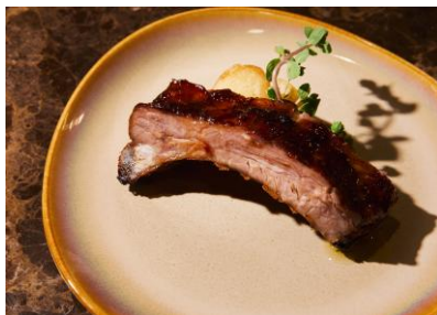
ポークバックリブ BBQ (ディナー)