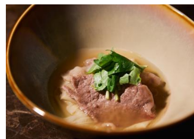
和牛焼きしゃぶ 湯葉餡かけ (ディナー)