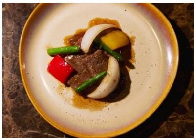
和牛のソテー チャイニーズスタイル (ランチ・ディナー)