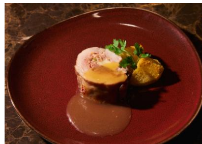
若鶏と和牛ミンチのガランティーマ (ランチ)