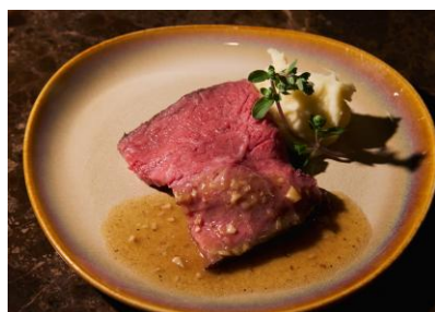
和牛ローストビーフ (ディナー)