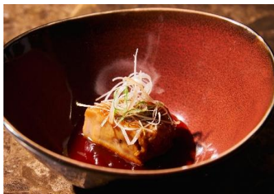
厚切り豚バラ肉のコンフィ 芳醇な特製醤油ソース (ランチ・ディナー)

和牛焼きしゃぶ 湯葉餡かけ / 合鴨の北京ダック風 / 厚切り豚バラ肉のコンフィ 芳醇な特製醤油ソース