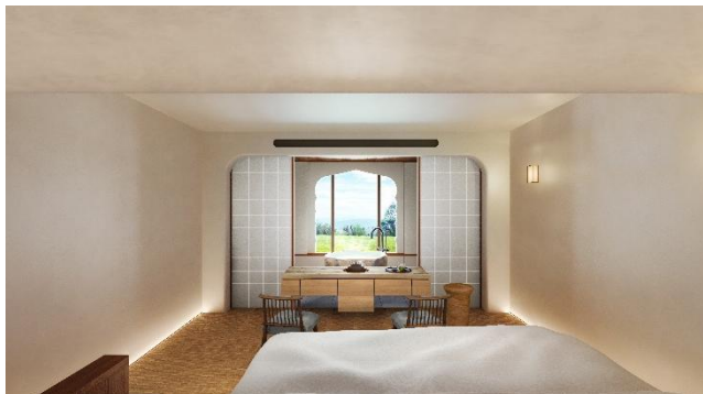
〈客室：スタンダードルーム〉