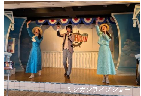
ミシガンライブショー