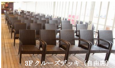
3F クルーズデッキ (自由席)

クルーズデッキ前方のステージでは、 ミシガンパーサーによる楽しい 観光案内やライブショーが 繰り広げられます! (見学自由)