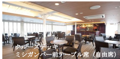
クルーズデッキ ミシガンバー前テーブル席 (自由席)