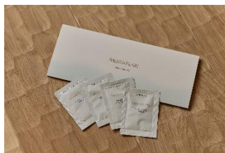
△「ムーンパール」スキンケアセット

洗面スペースには、お二人同時に利用いただけるダブルバースを完備いたしました。暮らすようにお寛ぎいただける、特別な一室です。