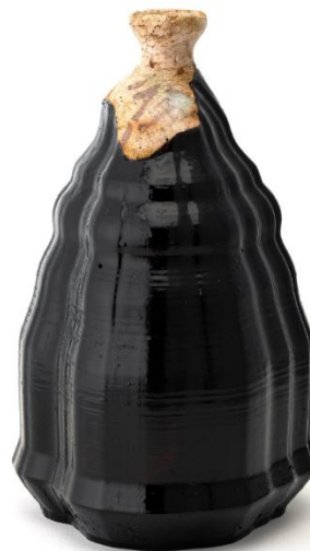
(左から) 異世界雲中菩薩 ストレージ∞の袋(©来田猛)、破壊されて転生したらLV9999の徳利になった件(©Pedro M Shimura)

漆造形作家である北浦氏は、縄文時代から続く漆の土着的な精神性を起点に、現代のサブカルチャーを鮮やかに融合させる気鋭の作家です。制作の核にあるのは、目に見えない恐れを漆によって可視化し、心の平穏を求める安心感の追求。破棄された陶片を漆の力で蘇生させる「呼継」を駆使した《陶片転生》シリーズは、代表的な表現の一つです。仏像に漆が施されてきた歴史的文脈を参照しつつ、現代の異世界転生における神的存在を仏像的な形式として再構成し、アニメ的な意匠と仏教の浄土観を重ね合わせた《異世界雲中菩薩》など、伝統素材を通じて現代的な救済と再生の物語を紡ぎ出します。本展では、これらの代表作に加え新作も公開予定。漆という素材から立ち上がる強い存在感と、救済の造形をぜひご堪能ください。