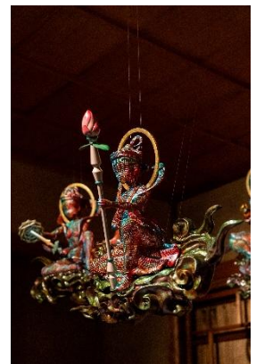
異世界転生雲中菩薩～来迎～ (©平垣内悠人)

また本展は、「生成中」という状態そのものを含んだ展示として構成している。漆によるレンダリングは、かたちを最終的に定着させると同時に時間の層を重ね、その過程を可視化する。物語のように見えるかたちが、いまだ生成の途中にあるというズレを通して、現代における救済と信仰のあり方を問いかける。