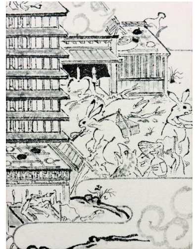
本展のための描き下ろしメインビジュアル