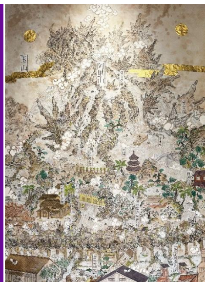
「We are probably in Tainan-鳥瞰図」2025

本フェアは、世界に羽ばたく可能性を秘めた次世代のアーティストの発信の場として来場者との接点を創出し、アーティストがフェアを主導するのが特徴で、今回で 9 回目を迎えます。メイン会場は国の重要文化財である近代建築「京都国立博物館 明治古都館」。歴史と伝統が息づく古都・京都を舞台に次世代の表現者たちが創造する現代アートが一堂に会します。