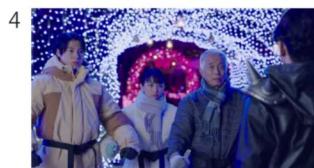
4 お客さん(カップル・おじいさん) 押忍!