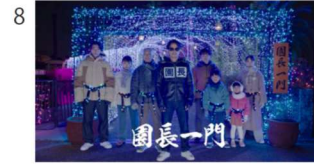
8 [NA] 園長一門