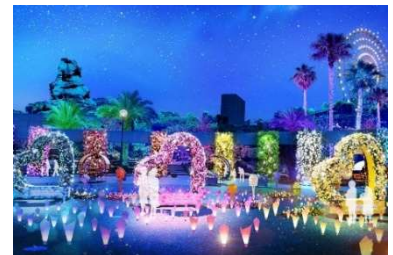
「押し活パーティー」イメージ

イルミネーションで装飾されたハートのベンチや写真撮影ができる小箱など、色とりどりのフォトスポットで、推しのカラーに包まれた写真が撮れる新エリア「押し活パーティー」がオープンします。