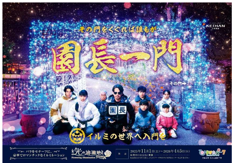
2025年度 秋冬ポスタービジュアル

秋冬ポスタービジュアルは2025年11月11日(火)から京阪電車沿線等で順次公開いたします。