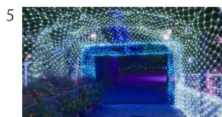
5 [NA] その門を