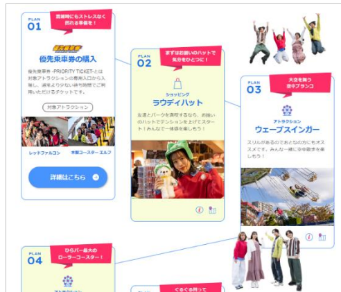
(左)「パークの楽しみ方」一覧ページ (右)「友達と過ごす」ご提案ページ