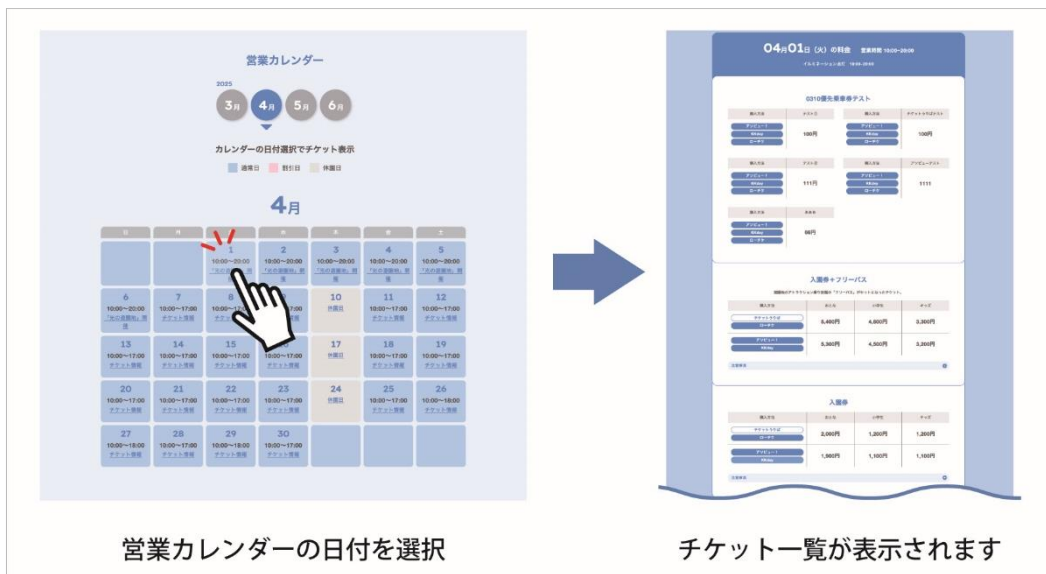
営業カレンダーの日付を選択

ひらかたパークでは入園券の他にフリーパスや季節ごとのイベント入場券、セット券など多種多様なチケットを取り扱っています。お客さまのご来園日やニーズに合ったチケットをスムーズに選択、購入いただけるよう、サイト導線を見直しました。