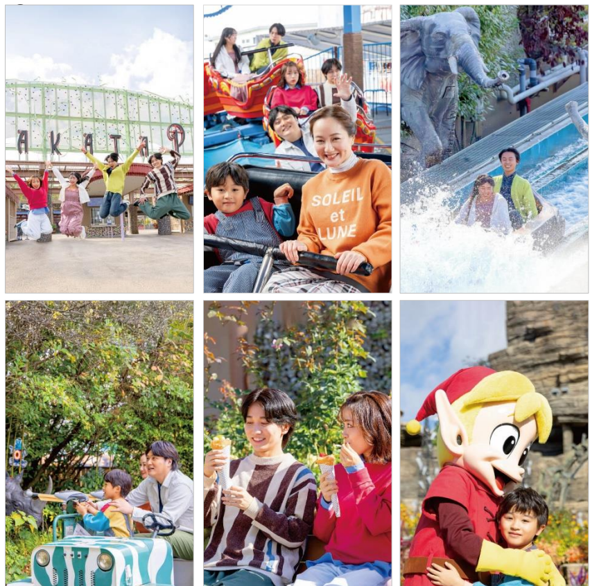
メインビジュアルで表示させる画像の一部。「ひらかたパークで過ごすワクワク」を伝えます。

公式WEBサイト： https://www.hirakatapark.co.jp/