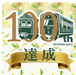
4駅達成オリジナルスタンプ