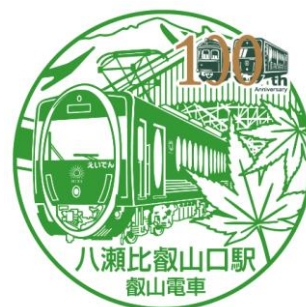
開業100周年記念デザインの例